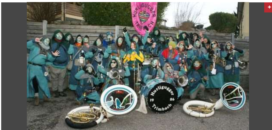
Die Hurligugger Trimbach freuen sich auf die kommenden Fasnachtstage.