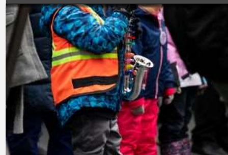
Hilari & Guggilari in Olten ▶